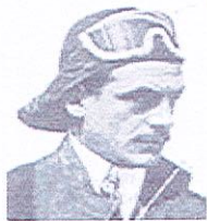
Eugène LEFEBVRE (1878-1909)